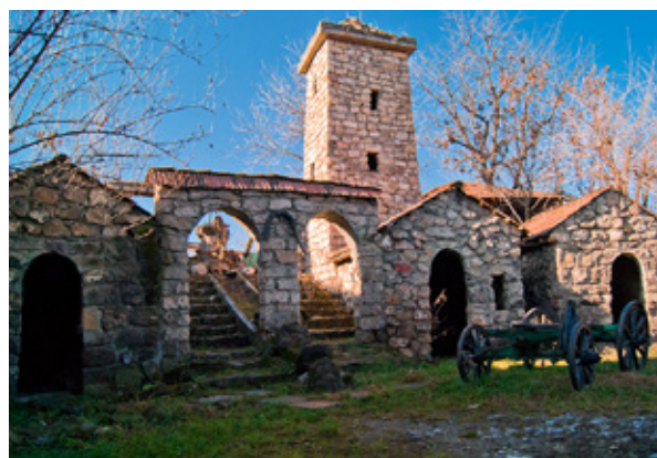
Рис. 2. Донди — Юрт (строения)

Аргунский музей-заповедник. Находится в самой живописной и, в тоже время, в самой высокогорной и труднодоступной части республики (рис. 3 и 4). В заповедник входят территории Итум-Калинского и Шаройского районов полностью, и частично Ачхой-Мартановского (Галанчож, Ялхарой, Акки и Хайбах), Веденского (Кезеной, Хой и Макажой) и Шатойского (Борзой, Тумсой, Харсеной) районов.