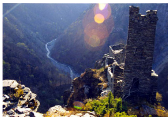
Рис. 3. Никаройские башни

Аргунский музей-заповедник. Находится в самой живописной и, в тоже время, в самой высокогорной и труднодоступной части республики (рис. 3 и 4). В заповедник входят территории Итум-Калинского и Шаройского районов полностью, и частично Ачхой-Мартановского (Галанчож, Ялхарой, Акки и Хайбах), Веденского (Кезеной, Хой и Макажой) и Шатойского (Борзой, Тумсой, Харсеной) районов.