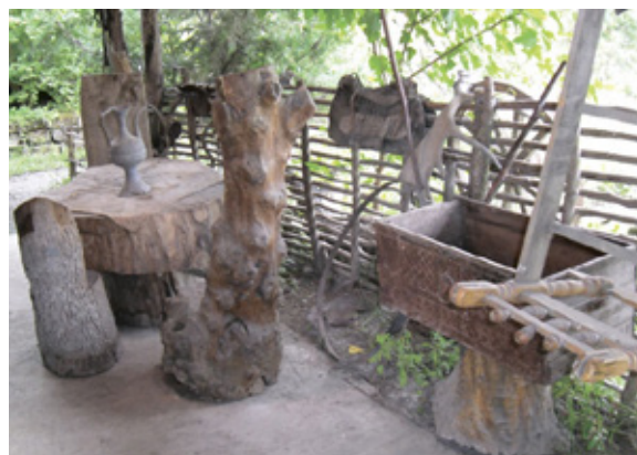
Рис. 1. Донди — Юрт (быт)

ными предметами быта, архитектурными сооружениями в национальном стиле и другими интересными экспонатами (рис. 1 и 2).