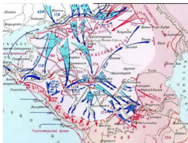
Рис. 2. Основные боевые действия ВОВ на Северном Кавказе