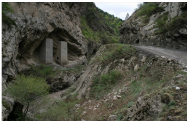
Рис. 4. Ушкалойские башни

На территории заповедника более 150 башенных поселений, в которых сотни жилых и боевых башен различной степени сохранности, около 20 культовых сооружений, более 150 полуподземных и надземных склепов. Всего на территории музея-заповедника находятся около 600 памятников истории, культуры, археологии и природы.