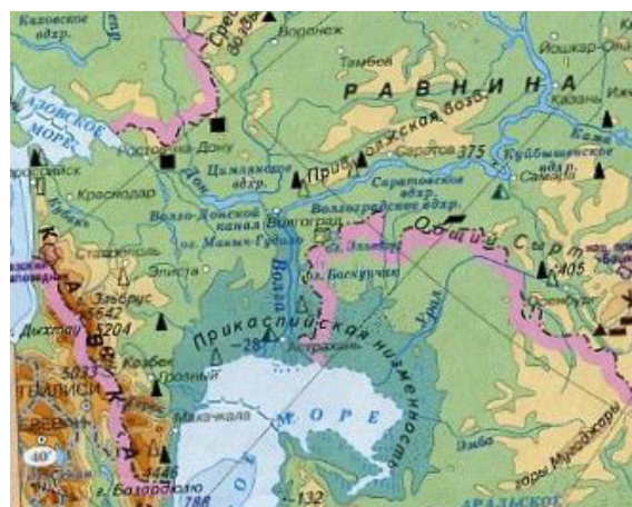
Рис. 1. Физическая карта Северного Кавказа

Зачастую одни и те же географические или исторические карты используются на истории и географии соответственно. Некоторые темы по истории требуют использования страниц атласа или географической карты. При рассмотрении основных событий ВОВ проходивших на Северном Кавказе, используется карта основных наступлений войск противника к нефтяным месторождениям, что лучше может быть продемонстрировано и использовано с помощью карты физической географии России или Северного Кавказа (рис. 1 и 2).